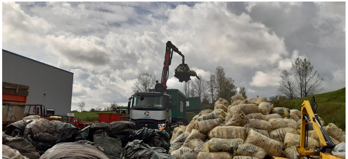
Site de Peaugres

13,1 tonnes collectées par site en moyenne, 2 sites ont collecté plus de 20 tonnes.